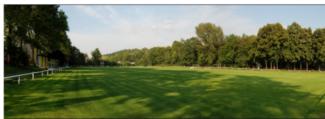
Hřiště Frýdlant nad Ostravicí