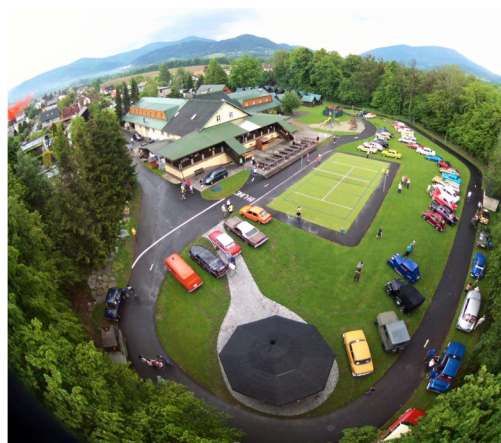
Areál Hotelu Budoucnost