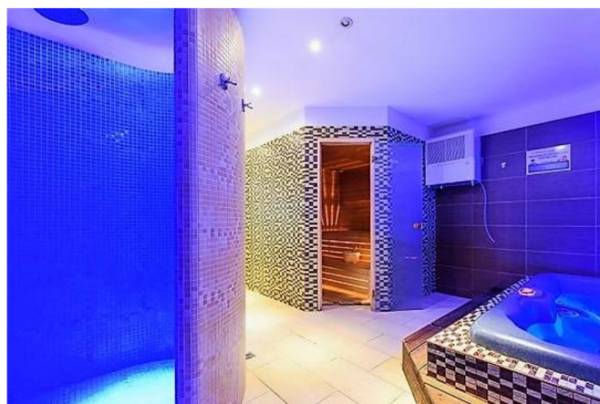
Wellness Hotel Budoucnost

8:00 - budíček 8:30 - snídaně 9:30 - přesun na trénink 10:00 - brankářský trénink na hřišti 12:30 - oběd 13:00 - vyhodnocení kempu předání cen 14:00 - odjezd domů (zajišťují rodiče)